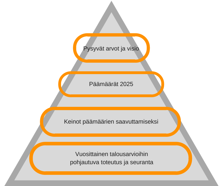
Kuva: Strategian rakenne