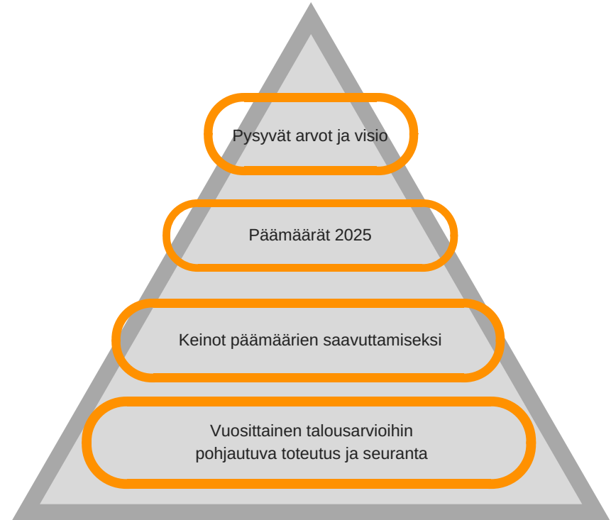
Kuva: Strategian rakenne