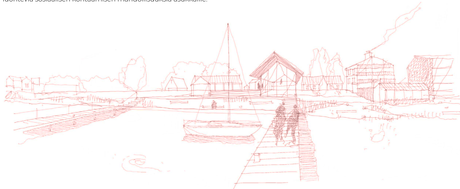
Näkymä venelaiturilta Ranta-aukiolle

Asuinrakennusmassojen polveileva asemointi avaa näkymät asunnoista joelle ja tekee rantasiluetista samalla joelta katsottuna yhtenäisen ja rauhallisen. Korttelit muodostavat suotuisan mikroilmaston ja luovat samalla luontevia sosiaalisen kohtaamisen mahdollisuuksia asukkaille.