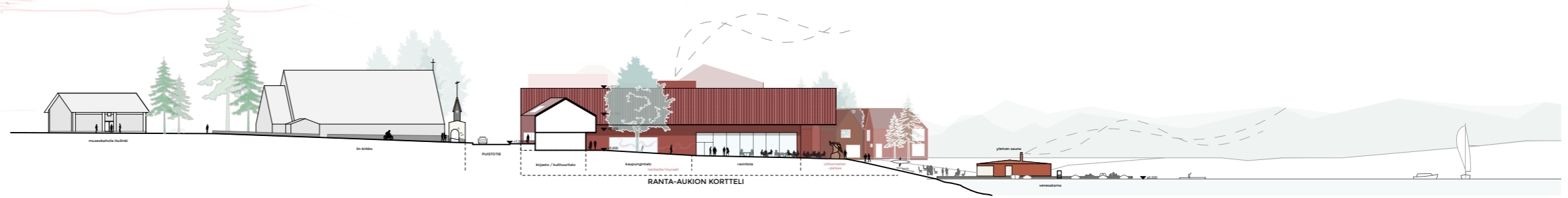
Alueleikkaus A-A 1:1000