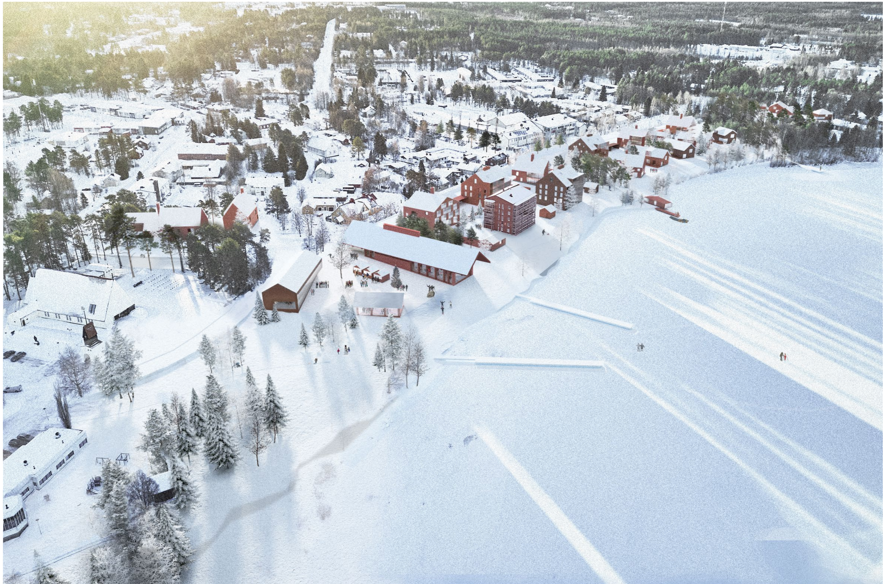
Ilmakuva Wanhan Haminan suunnalta