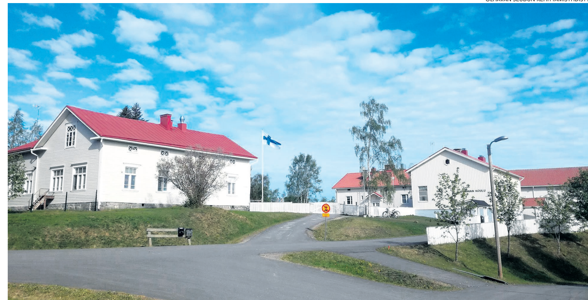
Olhavan koulu ja Tenavatupa.

Ennusteet huomioiden meidän tulee varautua isoon muutokseen, ei pelkää talouden näkökulmasta vaan kunnan elinvoimaisuuden näkökulmasta. Ensi syksyllä aloittaa noin 160 uutta ekaluokkalaista. Viime vuonna Iihin syntyi 90 vauvaa, jotka 7 vuoden päästä