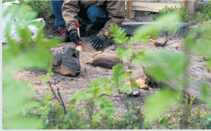
Ympäristö- ja yhteisötaidetahtumaan toteutetaan maaiheisiä teoksia ja paikallista ohjelmaa.