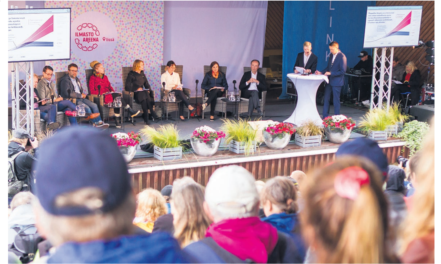
Elokuun IlmastoAreena keräsi lihin 6 500 kävijää sekä huimasti kiitosta ja kiinnostusta. Lavoille nousi yli sata esiintyjää, IlmastoTorilla toimintaansa ja tuotteita esitteli yli 50 toimijaa ja oheistapahtumia oli niin Huilingin ympäristössä kuin muuallakin lissä.

T ule mukaan – ideoi yhdessä, mitä IlmastoAreena 2020 voisi olla. Kokoonnumme tiistaina 17.3.2020 klo 18–19.30 Huilingin museokahvilalla. Halutessaan voit ilmoittaa tulemisestasi etukäteen sähköpostilla: hanna.lahti@micro-polis.fi , jotta osataan varata iltaan sopiva määrä pikkupurtavaa.