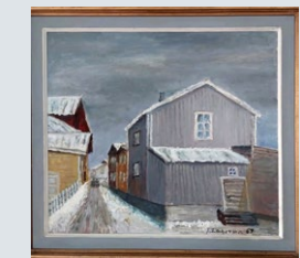
J.Laherma (1967), maalaus.