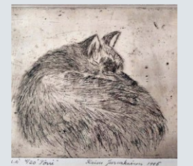
Kaisu Jurvakainen, Pörri (1995), grafiikka.