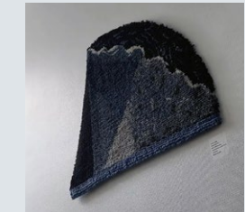
Aino Kajaniemi, "Surun varjo" - ryijy, (1991).