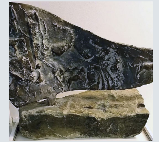
Sanna Koivisto, "Yhtäkaikki" – veistos (1990).

Lisätiedot: Taidekeskus Kulttuurikauppila, p. 050 395 0313, kulttuurikauppila@gmail.com Tekijät ja teokset: