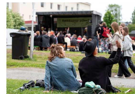
Nättepop piknik 2022.