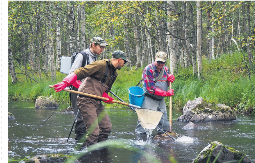
Sähkökoekalastusta Iijoen koskikunnostuskohteella.

Jätevedet laskettiin vielä 60-luvulle tultaessa suoraan vesistöön, mutta uu-