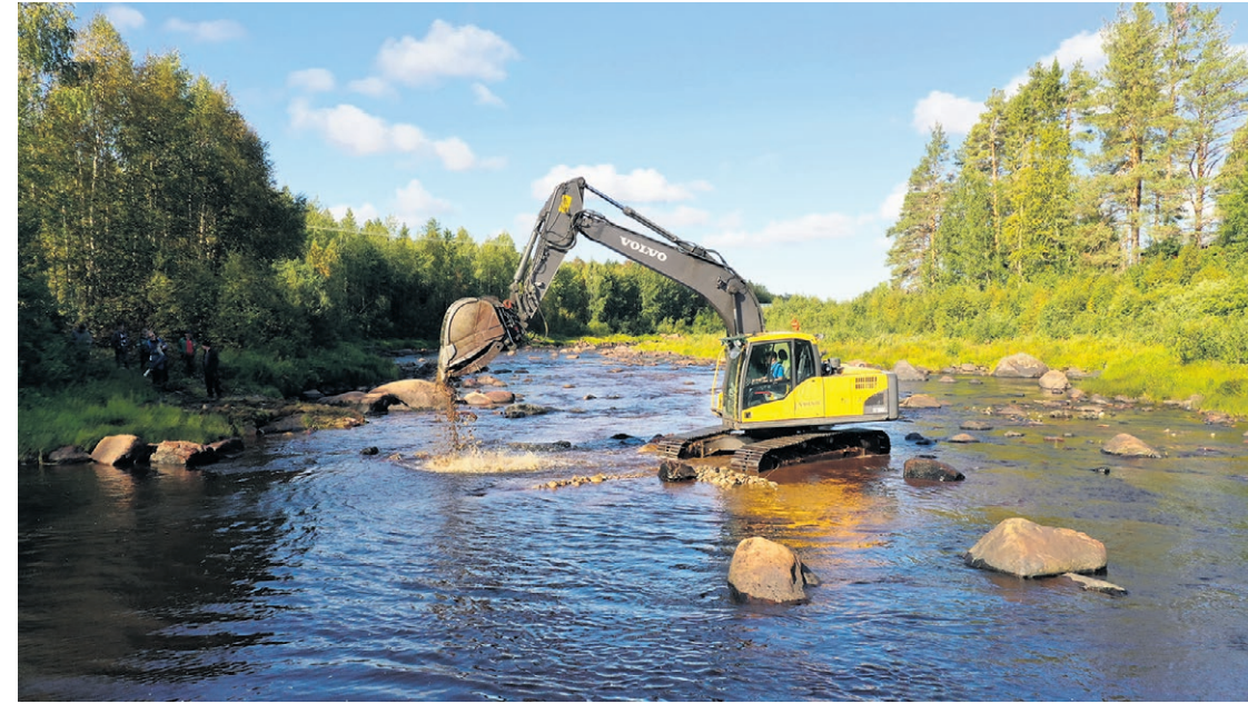
Kutosoran levitystä Näsiönkoskella Kuivajoella.

vajoen kunnostuksessa. Kuivajoen ja Olhavanjoen kunnostushankkeita pyritään jatkamaan lisärahoituksen turvin seuraavina kesinä.