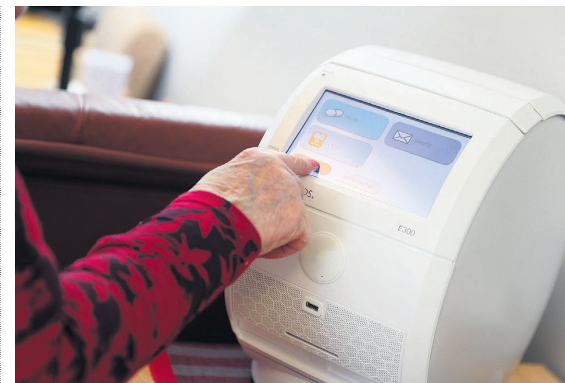
Vanhusten kotona asumista voidaan tukea teknologian avulla, kuvassa lääkerobotti.

- Uusia keinoja kuntalaisten palveluiden turvaamiseksi on kehitettävä, jotta kaikille voidaan asuinpaikasta riippumatta tarjota yhdenvertaiset palvelut. Samalla on rakennettava palvelujärjestelmä, jolla pidetään myös kustannukset hallinnassa. Asioi-